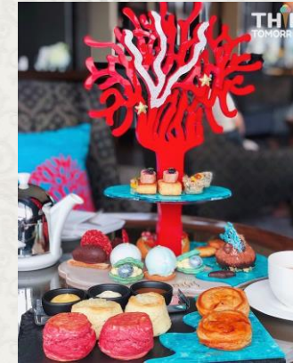
Gems of the Sea Afternoon Tea