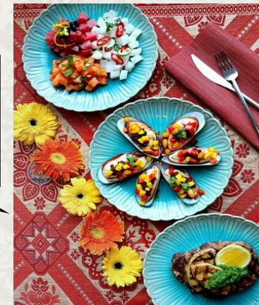
From Ocean to Mountain: Peruvian themed Sunday Brunch