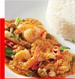
ข้าวราดผัดสะบัดช่อ