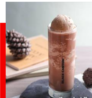
มอคค่ากาเซียเฟรปปี้