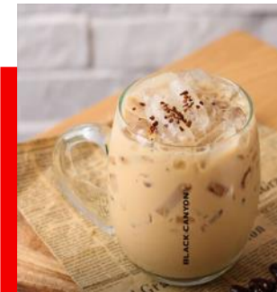
กาแฟเย็นแบล็คแคนยอน