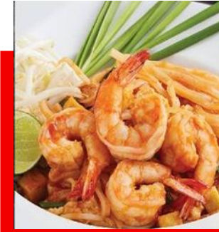
ผัดไทยเส้นจันท์กุ้งสด